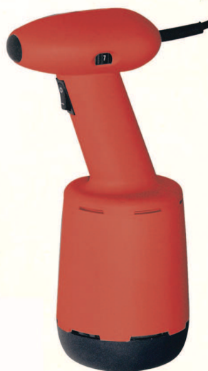
MO 350 VV