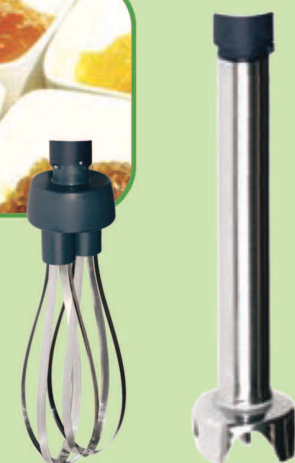
B 240 T 41