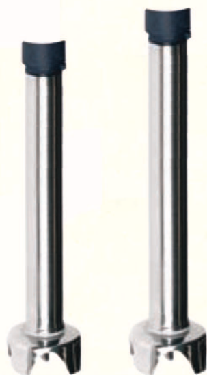
T 46 T 51