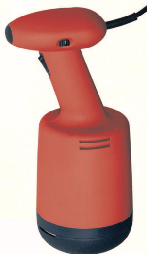
MO 550 VV